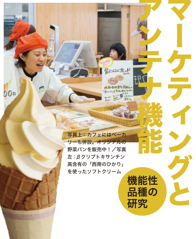
写真上：カフェにはベーカリーも併設。オリジナルの野菜パンを販売中！／写真左：βクリプトキサンチン高含有の「西南のひかり」を使ったソフトクリーム

こだわって作られた農産物を伝統的な方法でじっくりと調理する「スローフード」を簡単・手軽にぱぱっと食べられる「ファストフード」のように、現代人の生活スタイルにあった形で提供することで、お客様と農産品の距離を近づけ、日常の暮らしに取り入れるきっかけを提供します。