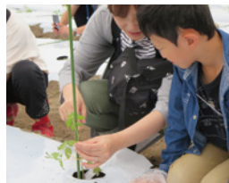
▲「なっ!とくしまスクール」農業体験、園芸教室の様子